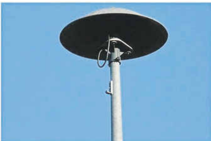
Am 06. März ist Warntag im Lahn-Dill-Kreis, dann werden auch die Sirenen in den Orten ausgelöst.

Probealarm zeigt, wie die Bevölkerung im Notfall am effektivsten gewarnt werden kann