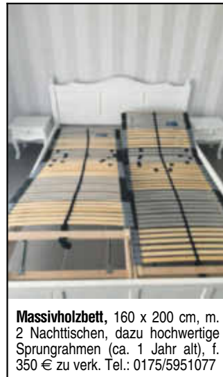
Massivholzbett , 160 x 200 cm, m. 2 Nachttischen, dazu hochwertige Sprungrahmen (ca. 1 Jahr alt), f. 350 € zu verk. Tel.: 0175/5951077

Zahle Höchstpreise f. Schrott/Alteisen u. Metalle/Kupfer, Messing, Edelstahl, Alu, Dachrinnen, Heizungsrohre, Kabelabfälle, Elektromotoren, landwirtsch. Geräte, Schlepper- u. Staplerbatterien, auch Katalysatoren. Alles anbieten, Abholung vor Ort, auch Entrümpelungen. Tel.: 0162/5906766